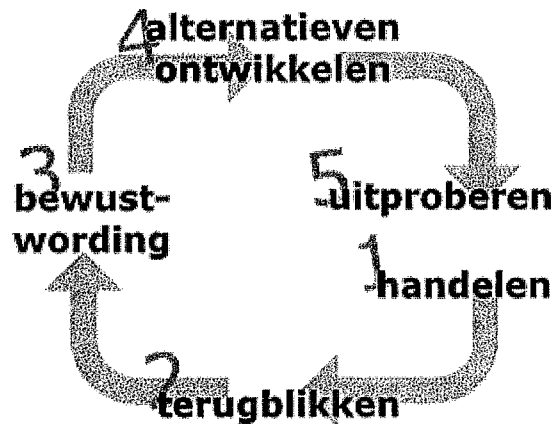
Reflectiecyclus van Korthagen

kunnen dan weer door de leerling worden uitprobeernd. Daar kan dan vervolgens weer op worden gereflecteerd.